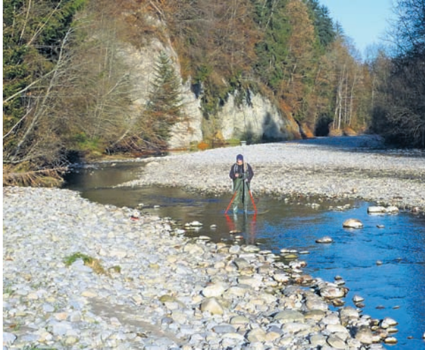
Ein Hydrogeologe misst den Wasserstand der oberen Emme.